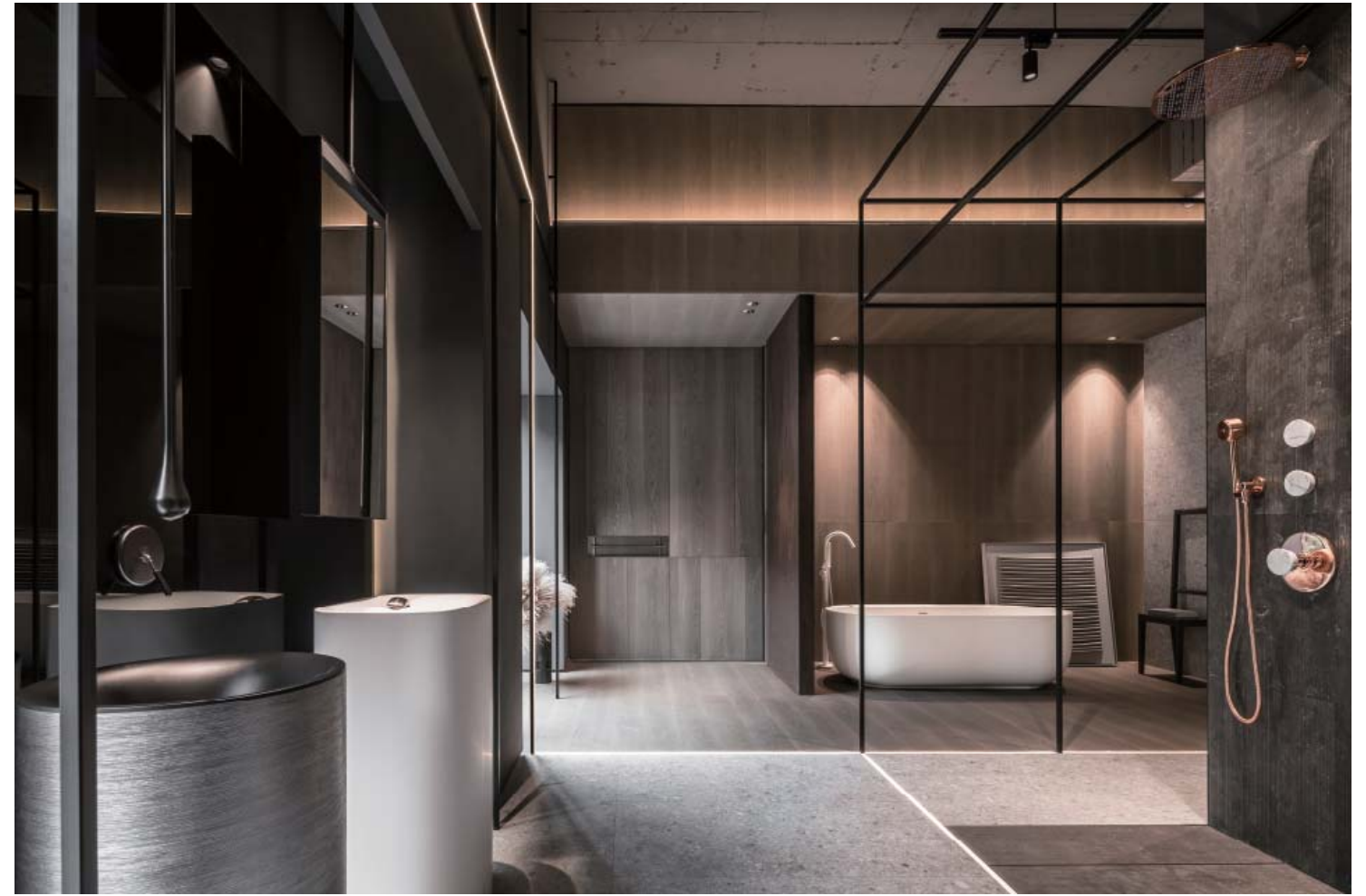
左頁·右頁：框架線條展現出虛量體的界定感， 雖輕猶重，為空間增添戲劇性地存在張力