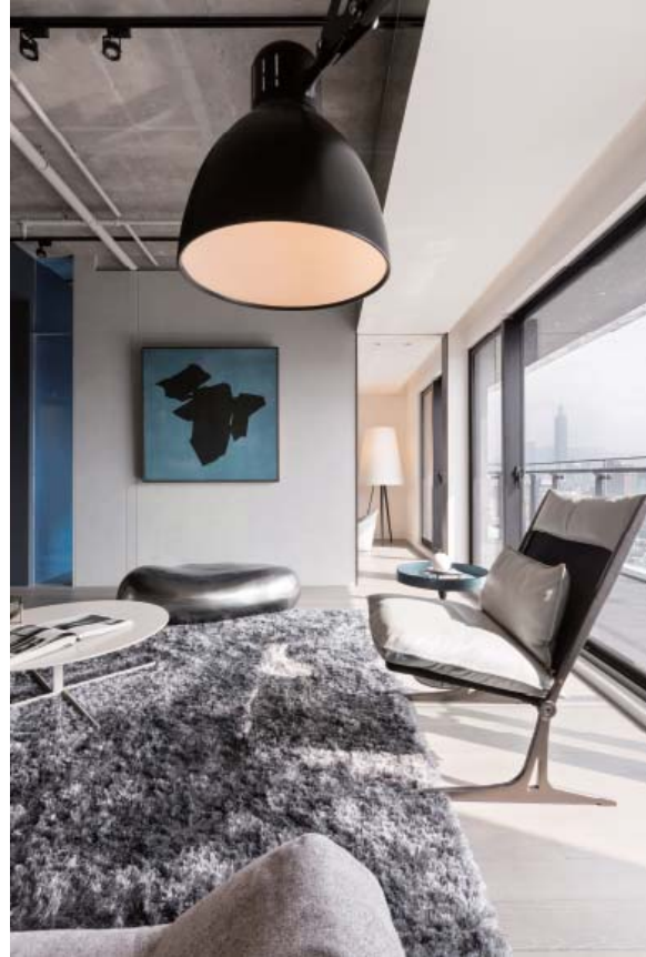
左頁·右頁：黑色巨型皮克斯落地燈襯托著台北景觀，燈具上端能夠看見柔和燈光的十字延伸

主要設計：唐忠漢·曾勇傑 空間性質：住宅 使用成員：夫妻·小孩2人 空間面積：198 m 2 主要建材：馬來漆·靛藍色漆·木地板 座落位置：台北市大安區 採訪：何芳慈