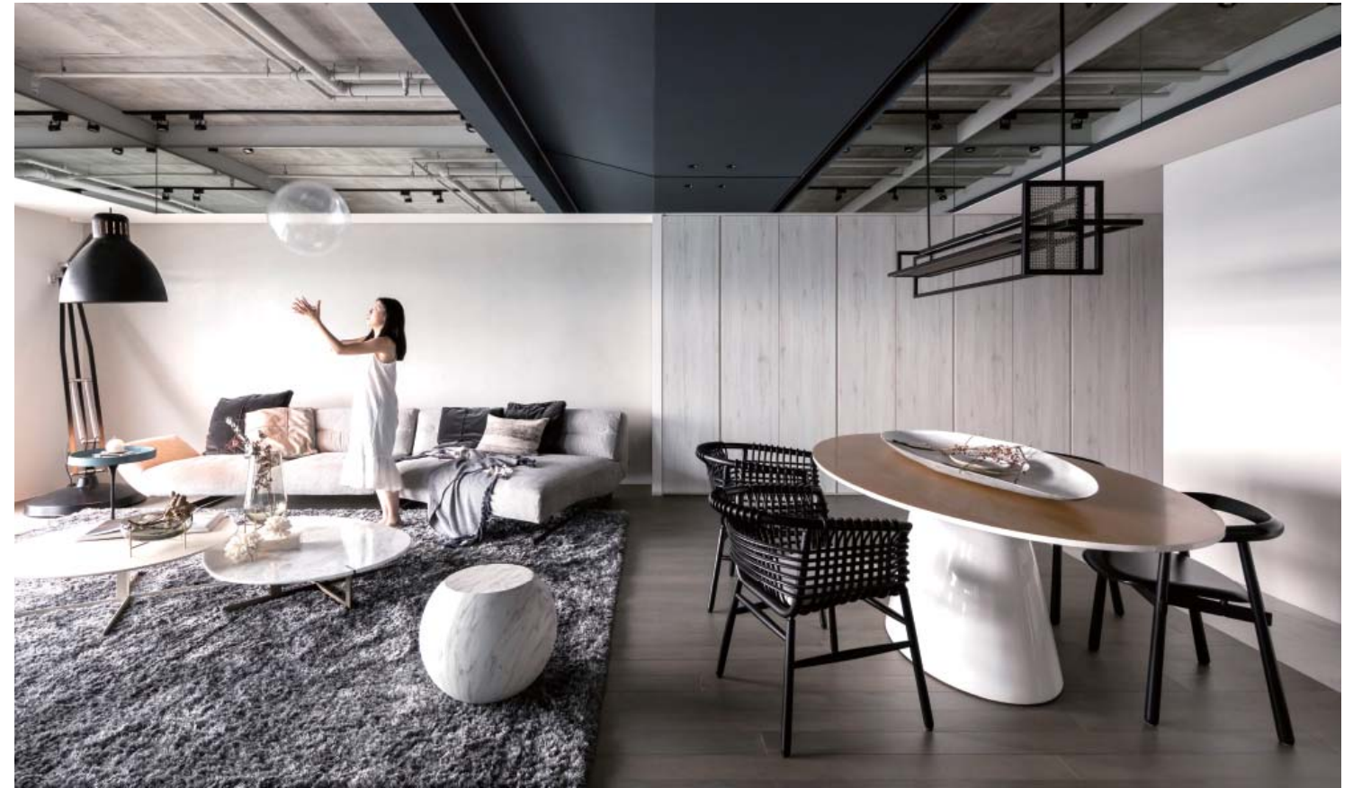
左頁·右頁：燈光暖調平衡冷色調空間的溫度， 為業主喜歡的現代未來感做基調鋪敘