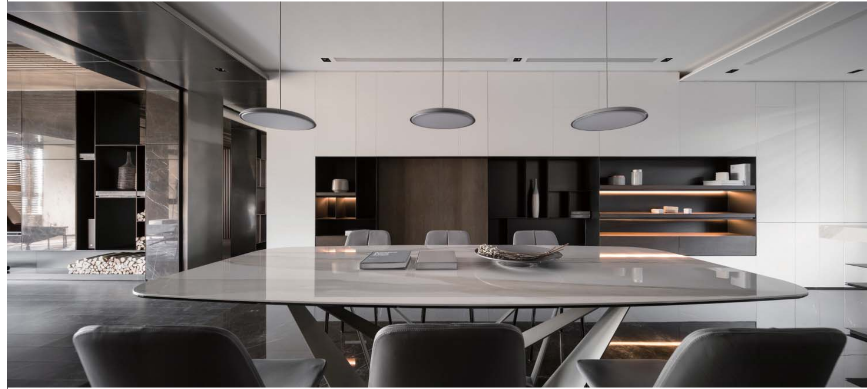
左頁·右頁：在本案將擅長的設計風貌淬鍊於純粹，於既存根基上賦予新意