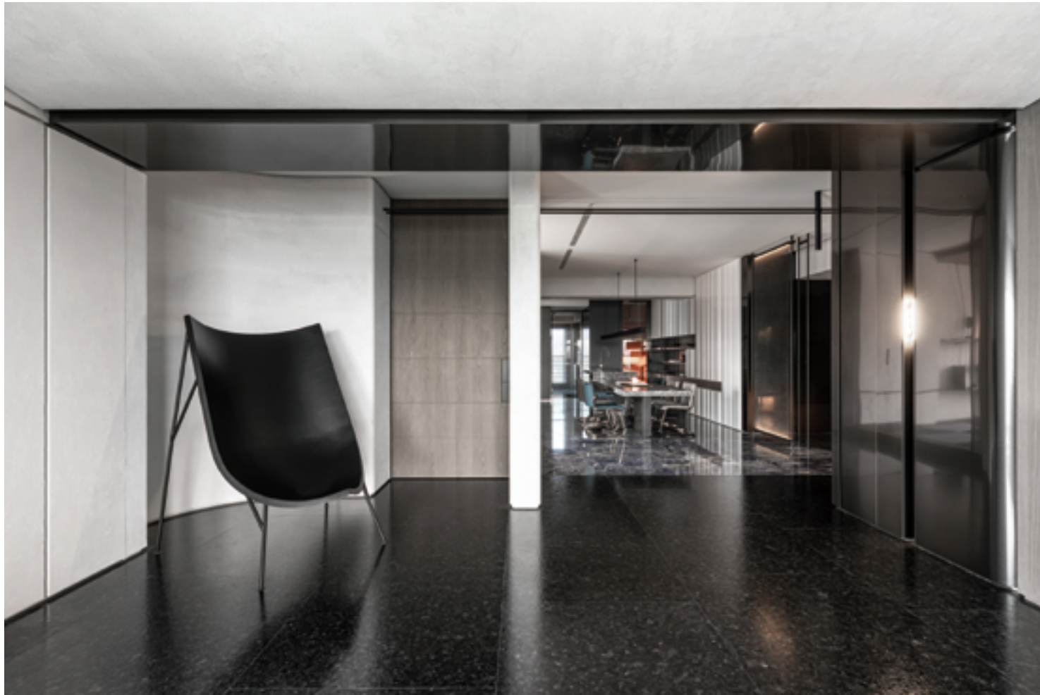
左頁·右頁：鏤空鐵件屏風讓金屬化身輕盈的 精緻工藝，述說空間細膩的個性與質感