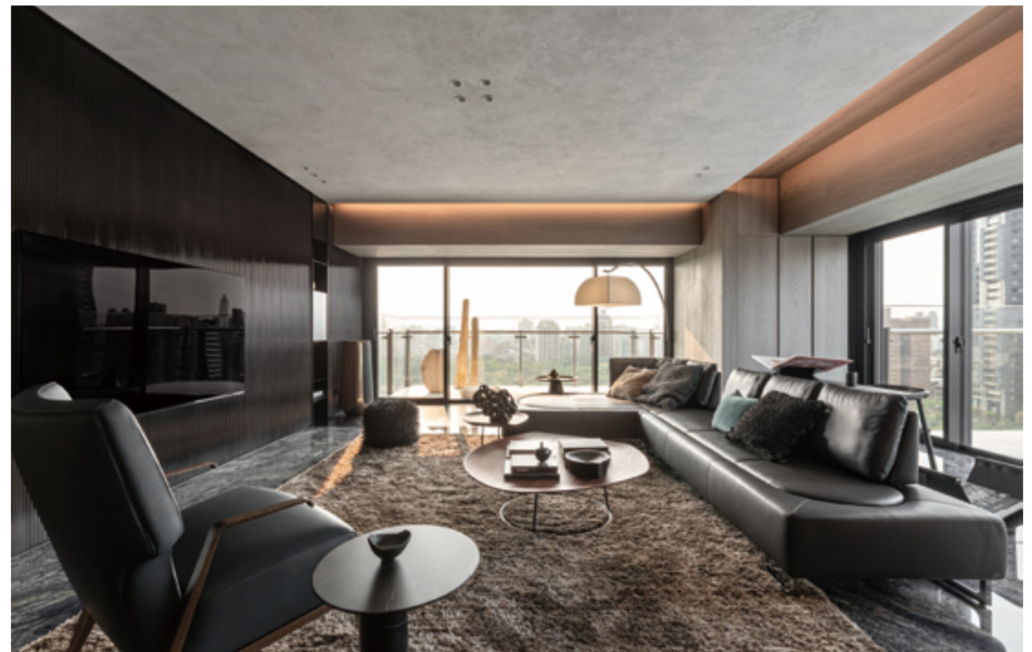
左頁·右頁：客廳與餐廳敞開尺度完美地銜接 空間前後，將日光與綠意引入室內