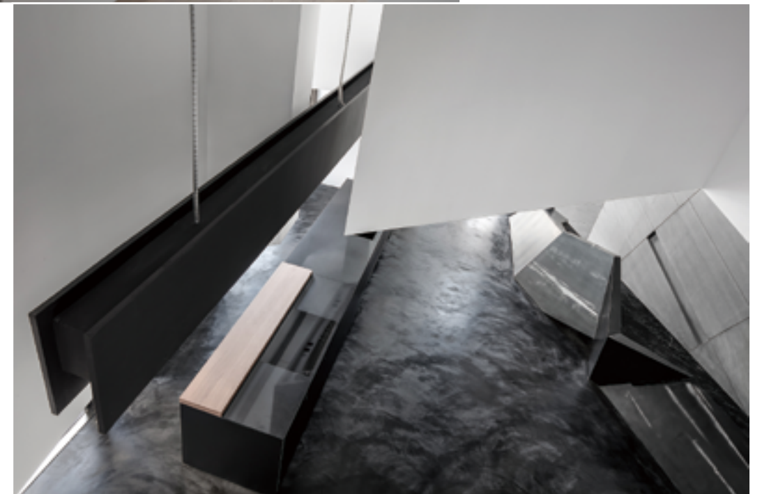
左頁：梯體外露結構結合照明吊燈 右頁：迂迴曲折的行徑動線，彷彿身陷於山谷之中