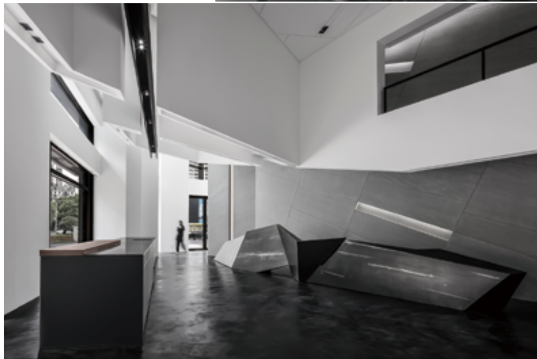
左頁·右頁：量體的堆疊架構，塑造了空間的獨特體驗