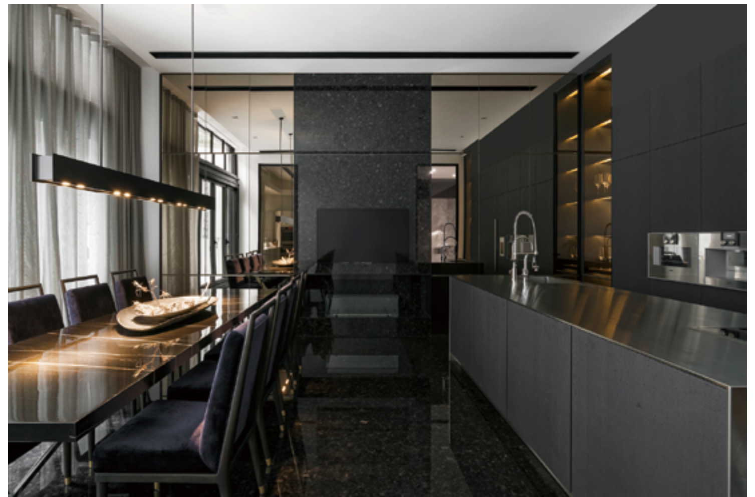
左頁：三樓主臥室空間，以流動概念串連各個區域 右頁：地下層的餐廚空間，可容納多人一同用餐