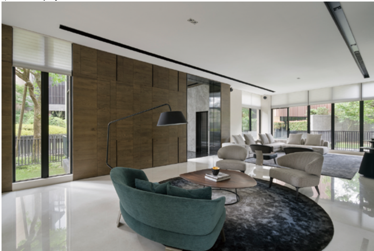
左頁·右頁：一樓空間為交誼場域，以兩套沙發劃分獨立區域