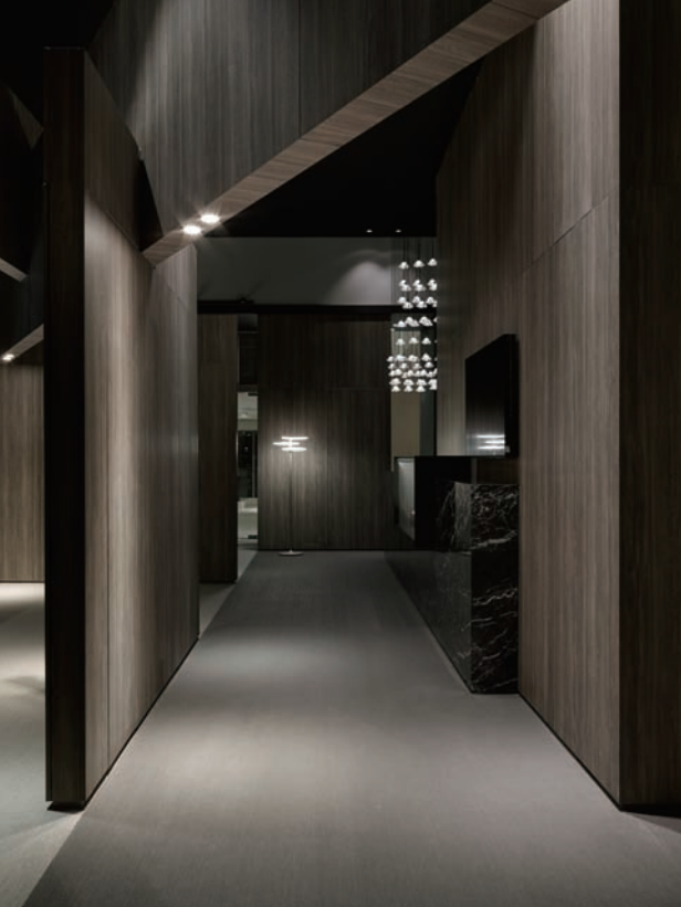
沉穩的木皮與編織地毯，低調的輔助照明，凸顯燈具的形影之美。

微光背景結合垂降天花板構成的框架中，燈具的造型之美與光影表現，彷彿舞台演出般充滿戲劇性，讓人過目不忘。