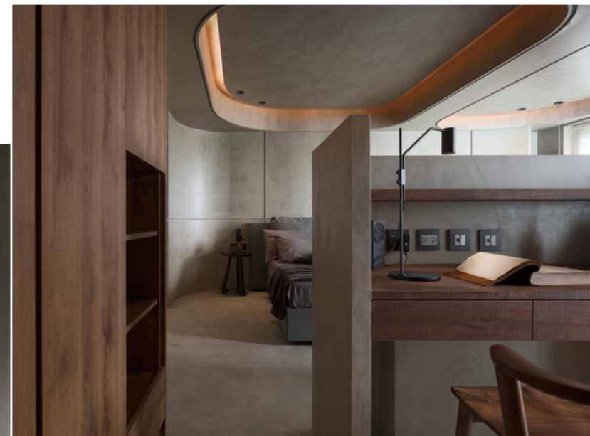
左頁·右頁：全室以灰階鋪陳天地壁，烘托光影帶來的豐富層次